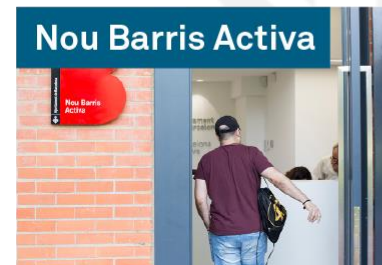
Nou Barris Activa