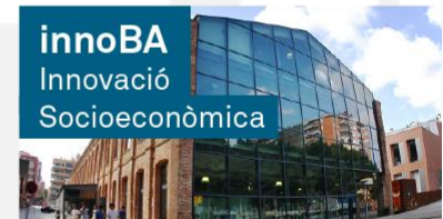
innoBA Innovació Socioeconòmica