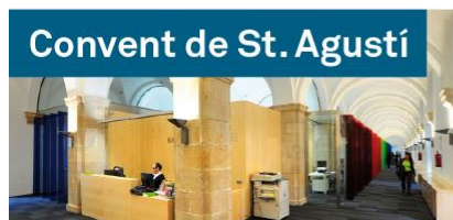
Convent de St. Agustí