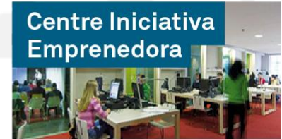
Centre Iniciativa Emprenedora