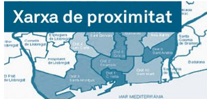
Xarxa de proximitat